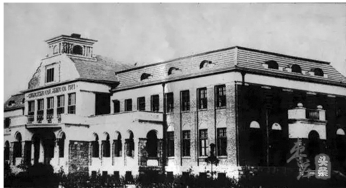
原中兴公司办公楼

当地人介绍说,前几年,最后一批职工下井的时候,国内不少媒体前来采访,记者们都怀着崇敬的心情,给这些奋斗了大半辈子的矿工们拍照,有的记者还当场流下了热泪。这些带着沧桑感的图片被发表后,引发了国内很多人的感慨,他们感叹我们枣庄人当年的拼搏、也致敬我们当年的伟大贡献。