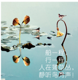
船一程 行一程 人在蒲草丛， 静听鸟鸣声！