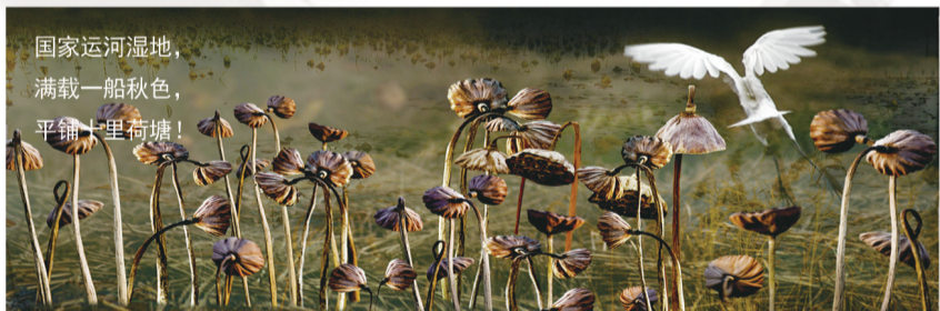
国家运河湿地， 满载一船秋色， 平铺十里荷塘！