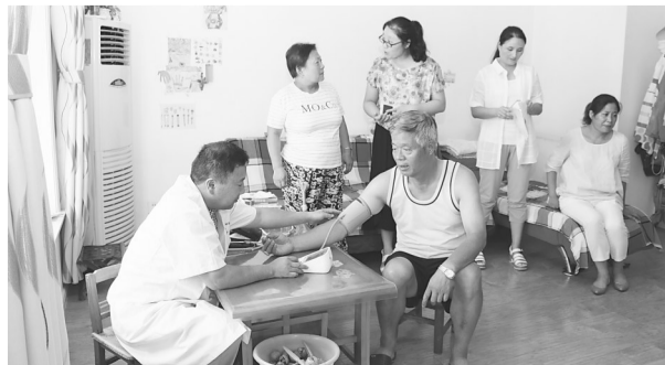
9月20日下午,龙山路街道计生协联合龙山路街道社区卫生服务中心,开展了签约医生服务计生特殊家庭签约活动。图为,签约医生正在为计生特殊家庭成员提供保健服务。