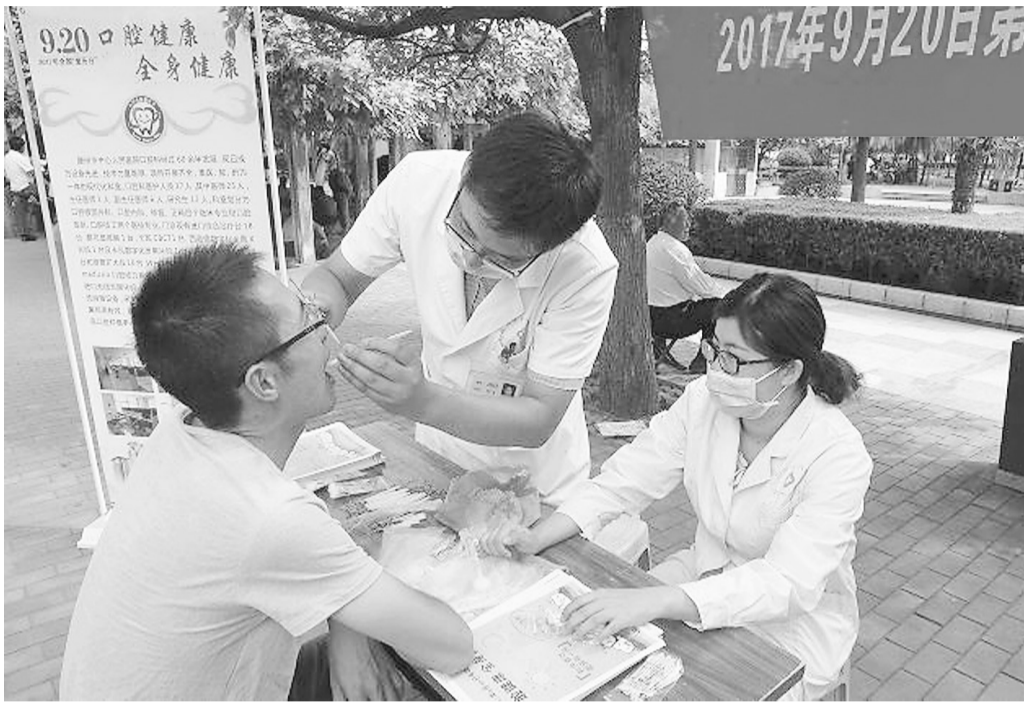
滕州市中心医院医务人员为市民免费提供口腔义诊。

同时,9月20日当天,各区(市)卫计部门和各乡镇街道卫生院等医疗单位,分别根据各辖区实际情况,通过进学校、赶大集等多种形式的主题宣传活动,确保宣传内容的科学性和实用性,为市民免费进行口腔检查,普及口腔保健知识,深受群众欢迎,大力推动了我市口腔疾病防治事业持续、健康发展。