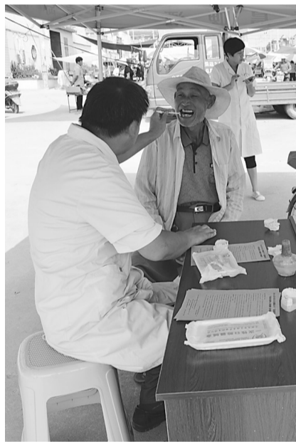
山亭区冯卯镇医务人员在农村集贸市场开展义诊宣传活动。