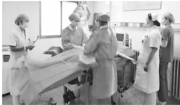
9月20日下午,市中区妇幼保健院产科组织开展了羊水栓塞抢救模拟演练活动,进一步提高医护人员急救能力和协调能力。