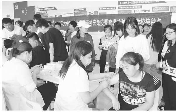
9月15-19日,高新区兴仁社区卫生服务中心到枣庄经济学校、枣庄职业技术学院,对2000余名2017级新生进行麻疹疫苗强化接种暨查漏补种。

10.建议成年人每半年到一年进行一次口腔检查,儿童每三个月到半年进行一次口腔检查。