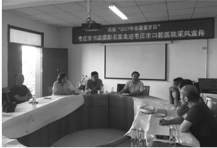
枣庄市书画摄影名家走进市口腔医院采风。