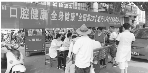
市中区中心街道社区卫生服务中心医务人员为群众讲解防治口腔疾病的相关知识。