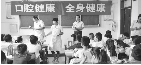
山亭区冯卯镇医务人员为学生进行爱牙护牙知识宣传讲座。