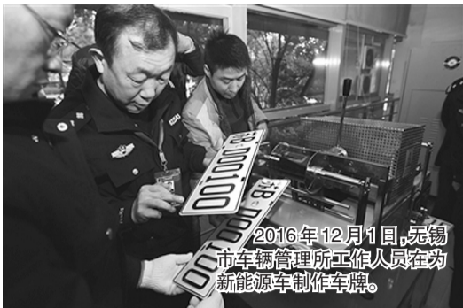
2016年12月1日,无锡市车辆管理所工作人员在为新能源车制作车牌。

8月13日,记者从公安部获悉,近日公安部在总结试点经验基础上,决定在全国范围内逐步推广应用新能源汽车专用号牌,到明年上半年,全国所有城市将全面启用新号牌。