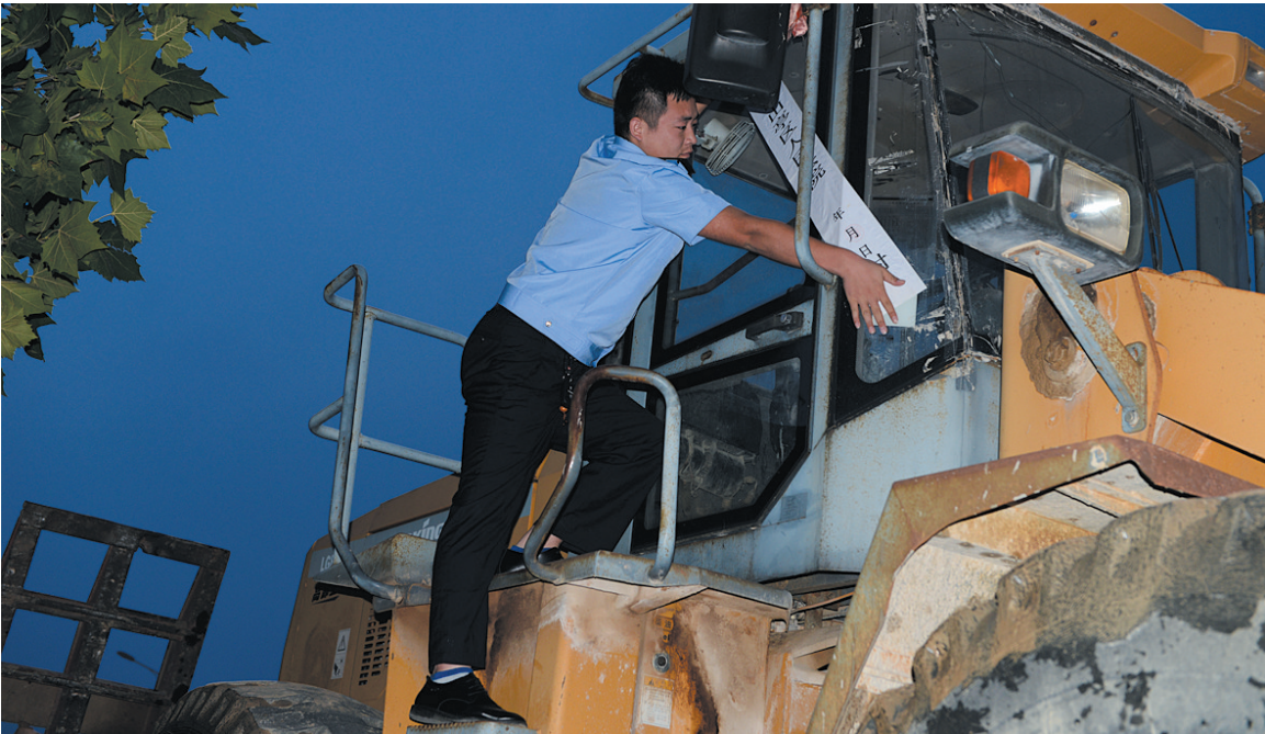
7月25日凌晨4点,山亭区法院驱车200余公里到日照市抓“老赖”,在东海区法院执行干警的大力协助下,成功扣押了一辆工程车。近期,山亭区人民法院组织有经验的干警先后赴杭州、上海、盐城等地进行分类跨域执行,进一步挤压“老赖”生存空间。

办理人大建议、政协提案工作与“安全生产”、联系服务群众“百千万”活动、城市精细化管理、“创卫”“创城”等工作相结合，全面推行“网格化”管理模式，落实每名执法人员的岗位职责，理顺了各项城市管理体制机制，切实提高了工作效率；完善干部职工教育培训、违法建设管控、户外广告管理等规章制度10余项，使工作有规可依，有据可查；建立值班制度，公布投诉热线电话，确保值班人员到岗在位，全天候受理群众反映的各类城市管理问题，切实做到投诉电话有人接，反映的问题有人查，查处的情况有反馈。