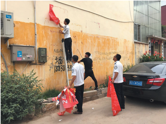
近日,山亭区城管局开展户外广告治理,集中拆除超期、无审批手续、存在安全隐患的户外广告、灯杆广告20余处。