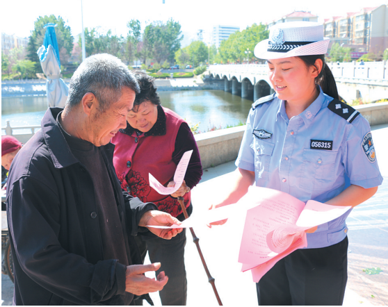
7月25日,峰城交警大队开展高温天气交通安全集中宣传活动,提醒广大群众坚决杜绝酒后驾驶、超速、超载、疲劳驾驶等违法行为,自觉养成“遵纪守法、文明行车”的良好习惯。