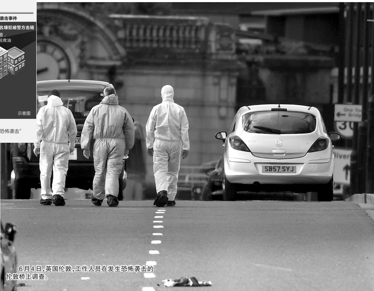
6月4日，英国伦敦，工作人员在发生恐怖袭击的伦敦桥上调查。

恐袭再次在英国发生，这次发生在伦敦桥。从伦敦议会大厦汽车冲撞人群到曼彻斯特体育馆自杀式爆炸袭击，英国持续被恐怖袭击阴云笼罩。 伦敦怎么了？为什么又是英国？还有多少恐袭“在路上”？