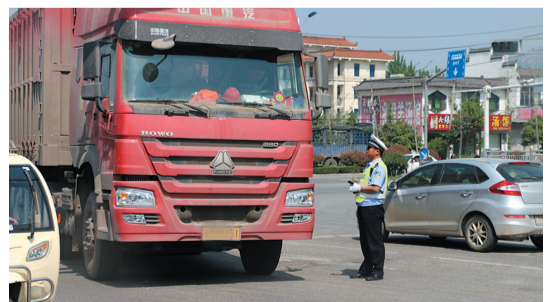
4月24日,峯城交警大队开展货运车辆交通秩序专项整治工作。采取定点设卡和流动巡查的工作方式,整治货运车辆超载、超速行驶,以及随意停车等交通违法行为。

近年来,市中公安局西王庄派出所为有效缓解基层警力不足,大力实施“一村一警务助理”工作。目前,全镇18个行政村村村配有警务助理人员,实现了警务助理全覆盖。图为4月29日,市中公安局西王庄派出所民警赵国庆(右一)和前小湾村警务助理朱福伟(左一)在村民胡福奎(右二)家中走访,了解社会治安情况。