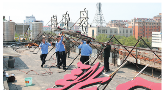
近日,台儿庄区城市管理局对运河大道进行排查,在全市率先拆除违规设置字体广告,保持运河大道整洁靓丽的旅游通道形象。

晚报讯 (通讯员 颜亚婷)薛城区城市违法建设治理行动领导小组于4月12日下发了《薛城区城市违法建设治理工作考核办法》,并将违建治理工作考核成绩纳入对相关乡镇、街道(临城、巨山、沙沟、常庄)的经济社会发展综合考核,考核成绩每季度通报。督导考核提升了各乡镇、街道、开发区违建治理工作积极性,确保了考核指挥棒充分发挥作用,形成了违建治理长效机制。自薛城区启动全面考核措施后,违法建设治理微信群里每天都通报违建拆除情况,形成了“争着干”、“比着干”良好氛围。截至目前,薛城区共上报违法建设83.29万平方米,涉及344处违法建设。今年以来,累计拆除违法建设11.7万平方米,整改完成21万平方米,走在了全市的前列。