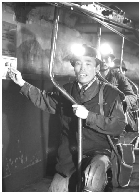
每天乘坐摇摇晃晃的缆车去采煤面。