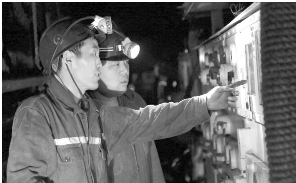
工友一声招呼,赶紧上前排故障。