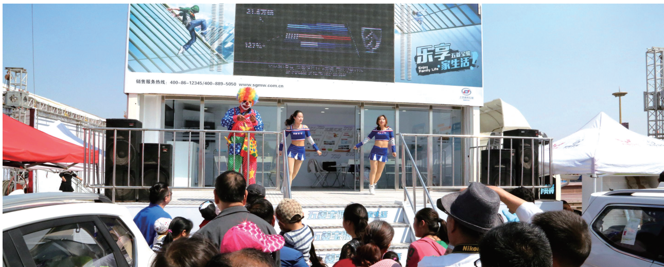
汽车宝贝热辣舞蹈助阵车展