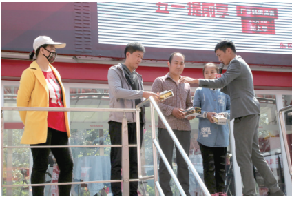
参与活动商家好礼相送