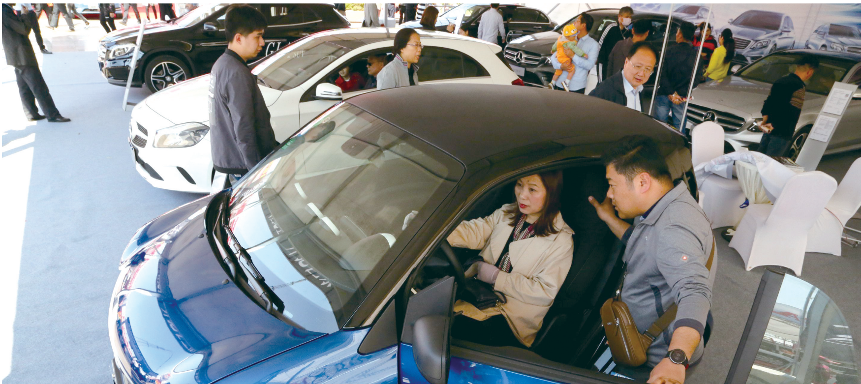
市民亲身体验试乘