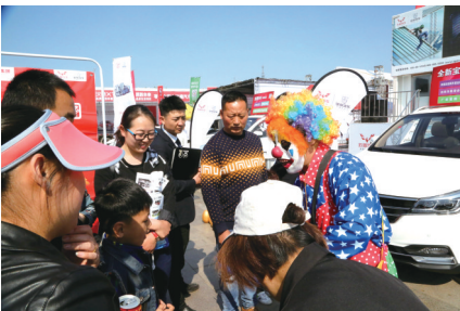
魔术气球送观车展市民