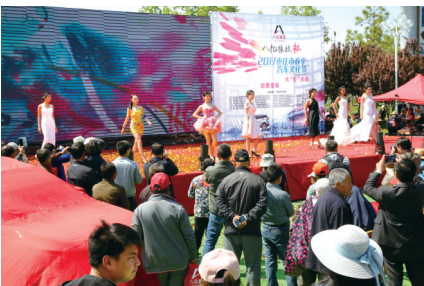
东方丽人模特佳丽们优雅的时装走秀