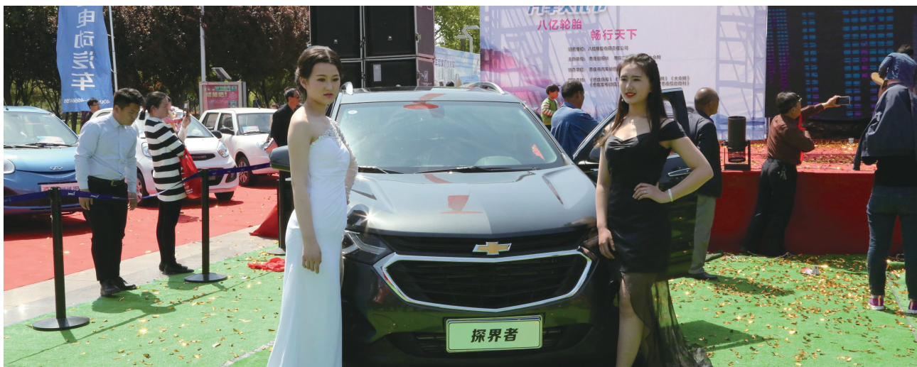
雪佛兰现场隆重推出新款汽车探界者