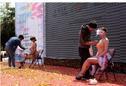
绚丽的人体彩绘点亮全场