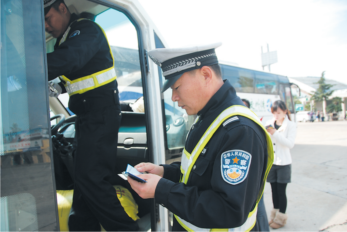
4月2日，市交巡警支队加大对客运车辆的交通安全检查，杜绝隐患车辆上路行驶，确保旅客的乘车安全。

截至目前，薛城法院审理涉农案件67件，执结涉农案件38件，有效地服务了辖区春耕生产，赢得了群众的拍手称赞，真正实现司法惠农。