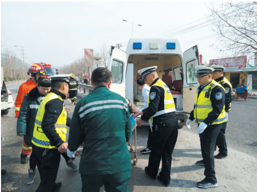
4月4日，峰城交警在执勤中发现，一辆货运车辆与一辆轿车相撞，其中一名群众受伤，交警立即上前救助伤者，并拨打120急救电话等待救援，帮助医护人员迅速将伤者抬上救护车辆，引导120救护车快速离开。