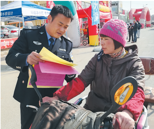
近日，滕州市东郭镇法治副主任走上街头开展清明节安全教育宣传活动。法治副主任重点向群众宣传了《森林法》、《森林防火条例》、《消防法》、《文明祭祀倡议书》等法律法规和道德常识。

通过反复做两户人家的思想工作，最后达成协议，李某某和王某分别出300元修理费把浴缸移开检修。“虽然这对你有损失，但却既能解决邻居困扰，又能缓和邻里矛盾，何乐而不为呢？”听了司法所工作人员的话，王某叫人移开卫生间的浴缸，更换了下水管。至此这起楼房漏水问题得到彻底解决。