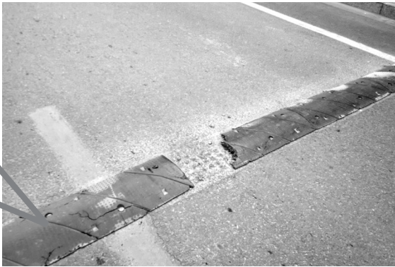
减速带破损无法起到减速的作用

晚报讯 (记者 寇光 摄影报道)“明明这条路限速40,可是经常会有车辆超速。减速带磨损的厉害,基本和没有差不多,根本起不到限速的作用。”近日,家住高新区凤凰山东区的王先生打来热线电话,称凤凰山小区和凤凰山小区东区门前的无名路上,由于减速带破损严重,因此过往车辆速度较快,频现超速现象的同时,给附近的居民和过往的行人带来了一定的交通安全隐患。2月27日记者对此展开了调查。