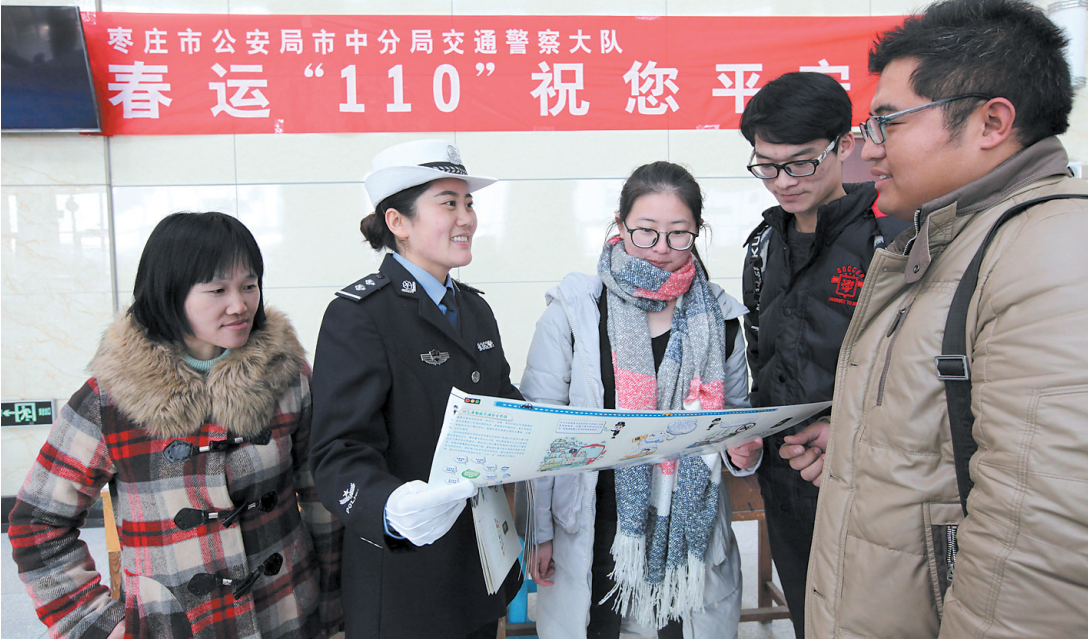
春运临近,市中公安分局交通警察大队开展“春运‘110’祝您平安回家”活动,抽调300多名交警组成执勤组、安保组、宣传服务组、应急组等8个小组,用“110”的精神和速度确保2017年春运期间道路交通安全畅通,帮助群众平安回家过大年。图为1月9日,市中公安分局交通警察大队在枣庄客运中心设立宣传服务站点,向乘客宣讲春运安全知识。

起。 加强对突发事件应对措施。每天早晚在责任区域内巡查一遍,发现抢建行为即查即拆。因特殊情况或突发事故造成主要活动管理区域大面积交通堵塞,配合相关部门迅速处置。违法相对人如有暴力对抗执法行为,在场人员要首先录像取证,处置人员迅速到位。