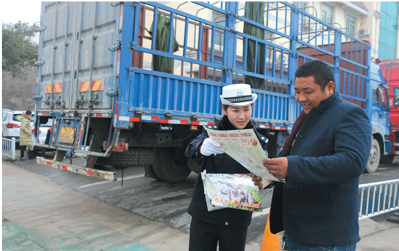
2016年12月22日,峰城交警大队开展道路交通安全知识宣传活动。通过发放宣传资料、短信平台、“双微”平台等方式,及时提醒广大交通参与者文明、安全出行。