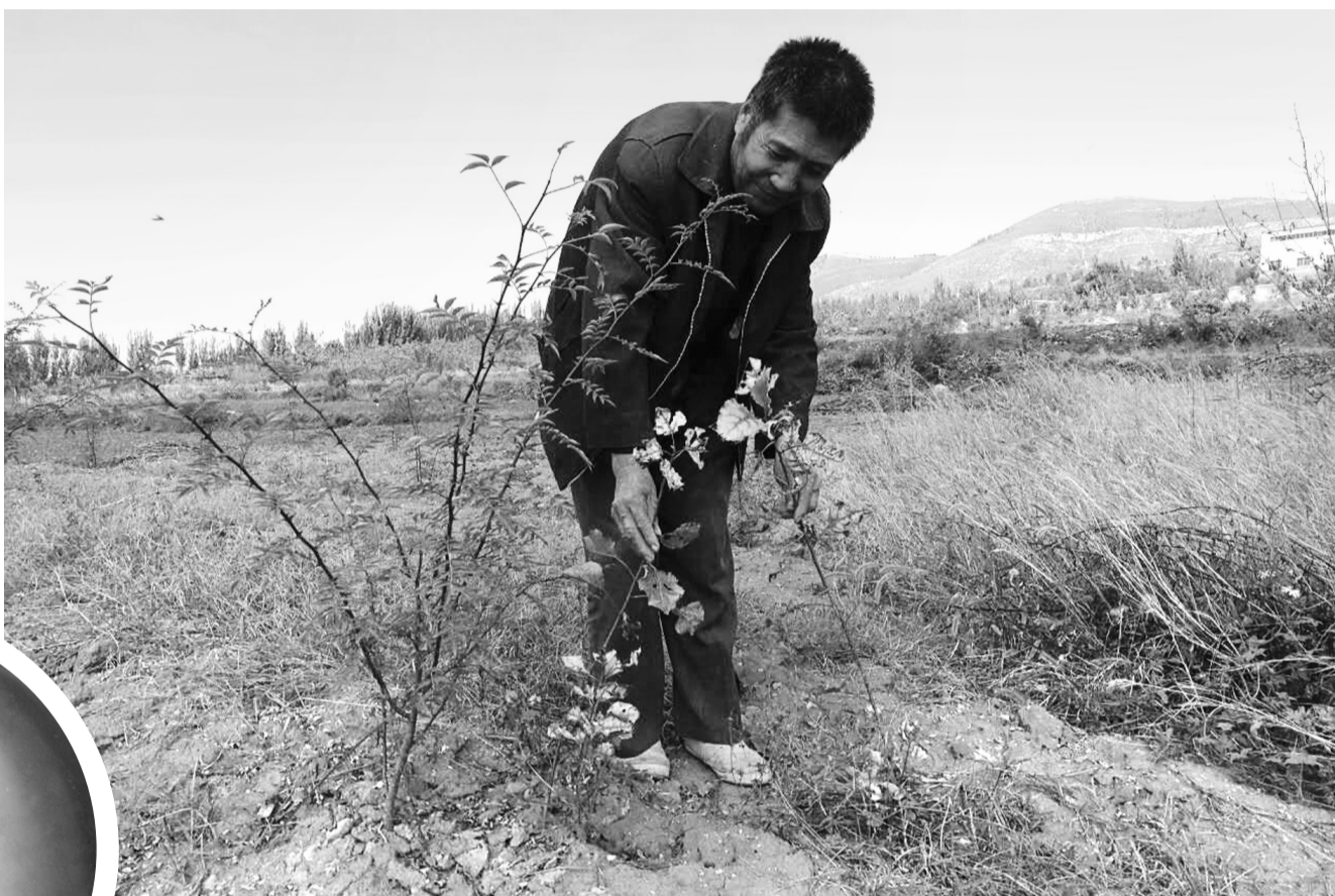
化工厂南面的部分植被还可见当时的枯黄状态

晚报讯(记者 王龙飞 摄影报道)近日,家住山亭区西集镇毛山村的村民拨打本报热线反映,称自从村东北处的化工厂建成后,厂子南面的农作物就开始出现枯死的情况,不仅如此,村民们日常饮用的自来水也出现了明显的变化,致使很多人不得不每天去相邻的孟庄取水喝。接到电话后,记者于10月7日上午赶往现场了解情况。