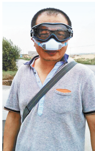
许多榆林人受到过敏性鼻炎的困扰