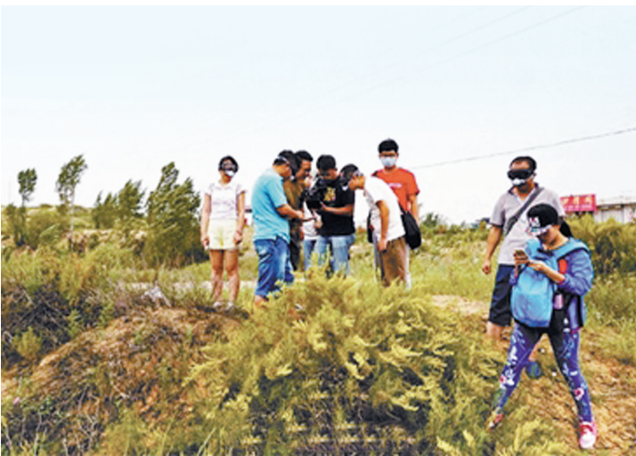
“榆林鼻炎自救联盟”来到沙蒿地进行实地调查