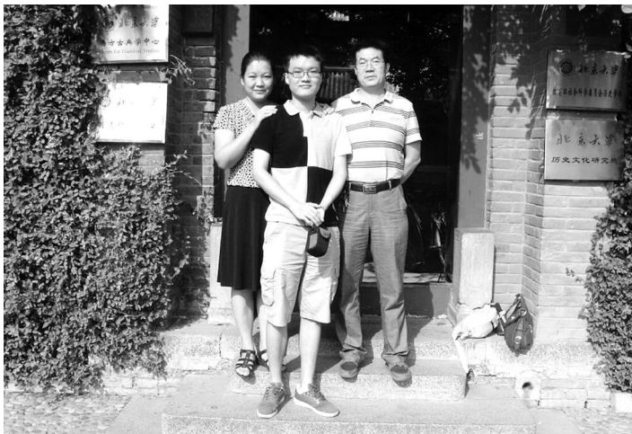
去美国读博士前在北大历史研究所前全家合影

采访到了最后,朱广地意味深长地说,不管儿子将来如何规划设计自己的人生,我们都希望他能融入时代发展的洪流中,与社会进步同步调。“自强不息,厚德载物”。无论何时,都要以爱国家爱民族爱人类的崇高责任感要求自己,以爱己之心推及天下人。“仰天长啸、壮怀激烈”,希望儿子有如岳飞般的爱国情怀及雄心壮志。