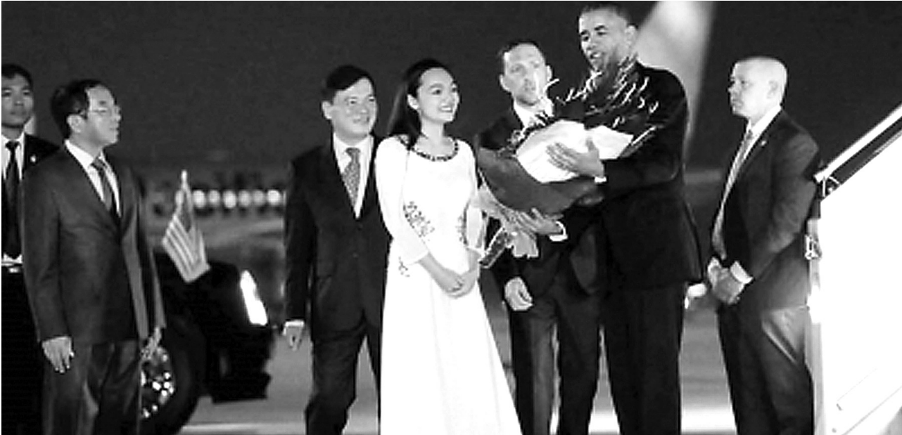
美国总统奥巴马5月22日抵达河内,开始对越南为期三天的访问,成为越战结束之后第三位访问越南的在任美国总统。

正在越南访问的美国总统贝拉克·奥巴马23日宣布,美国将全面解除对越南的武器销售禁令,但对越武器出口须“逐笔审议”。越南国家主席陈大光对美方决定表示欢迎,称两国关系“完全正常化”。 奥巴马22日晚抵达河内,开始对越南进行正式访问。美国和越南在1995年启动外交关系正常化。2014年美国部分解除对越南的武器销售禁令,允许对越出售海上安全相关的防务装备。