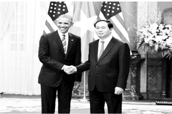
奥巴马与越南国家主席陈大光。