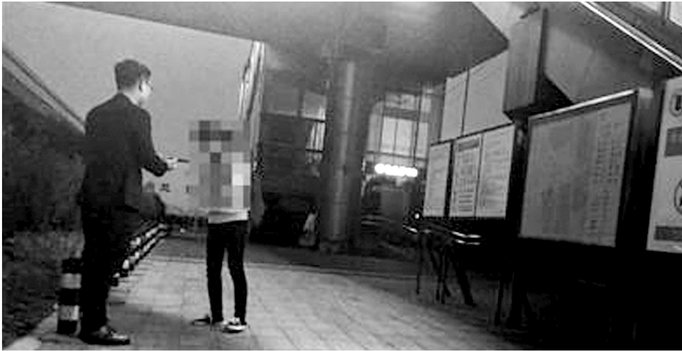
5月12日晚,“征卵子”短信发出者向一名女子介绍“捐卵”。