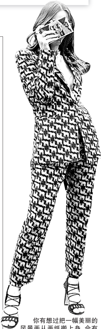
你有想过把一幅美丽的风景画从画纸搬上身，会有多美吗？这潮流太夯，你站在街边看风景，看风景的人在看你。好担心这么美的裙子会变成画纸飞走了。