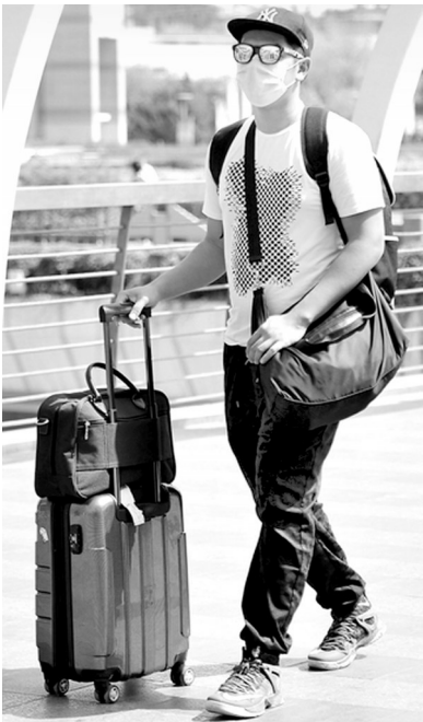
紧身T恤也是很不错的带有一点“娘”气的单品，同时又充满了张扬的男性气息，是很多身材健壮的男士们会选择的单品。