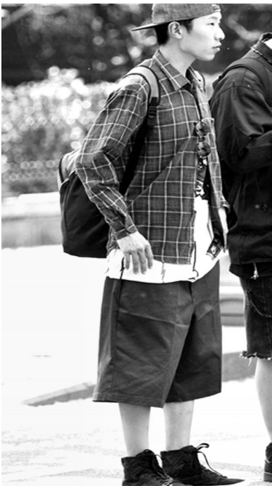
紫红色格子衬衫男女通吃，男生穿起来有着恰到好处的小闷骚，内搭白色嘻哈大体恤，下搭宽松版大短裤，令整个人看上去韩范十足。