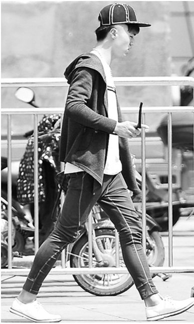
一件黑色卫衣，是不会出格的日常休闲装扮，简单利落，黑色瘦腿裤搭配金色平底鞋，也非常赞。