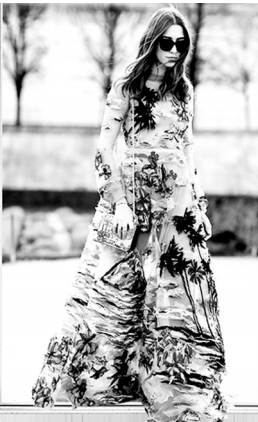
花哨的裙装搭上腰带拉长比例，背单色包包，就能美成画。

作为一名时尚 Icon，你还在执着于冷淡的黑白灰？亦或是抱着纯色系不放手，一心想把高冷进行到底？初夏百花开，鸟语花香，穿成一幅画非常应景。不管你是泼墨上绘画还是卡通画，都是不能忽略的时尚元素，都能给这个季节增添满分活力。暖风徐来，一股绚丽的印花风席卷时尚圈儿，或甜美浪漫、或自由不羁。