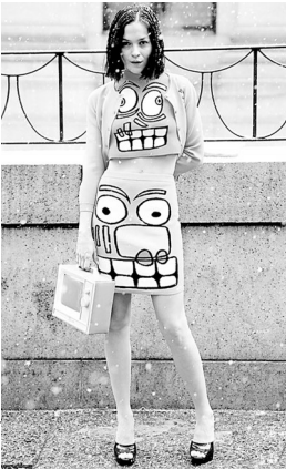
可爱的卡通画也可以从画纸搬上布料，这种新花样更少女清新。搭配一款趣味包包，想不被街拍都难。