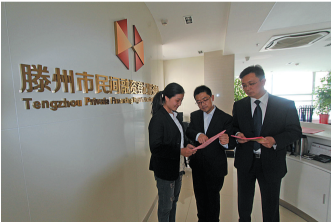
为金融机构提供法律服务