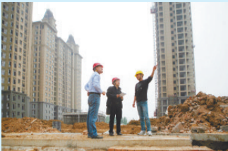
深入基层提供服务