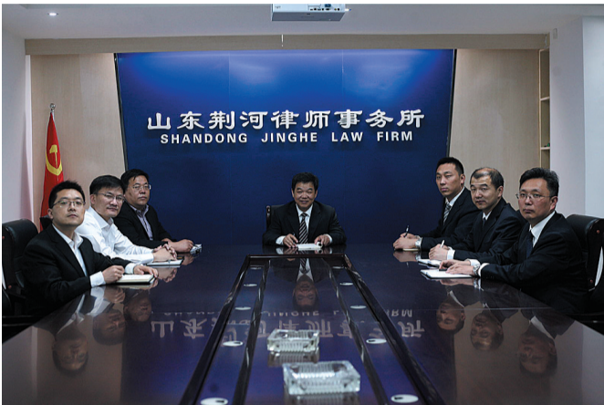
年富力强的荆河律师事务所管理层