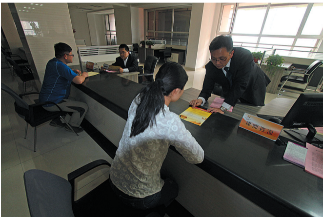
向市民提供法律咨询服务