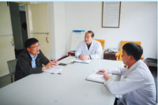
深入医疗机构提供法律服务