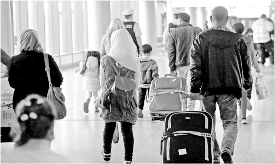
4月14日,一批经过联合国难民署确认的难民抵达德国。