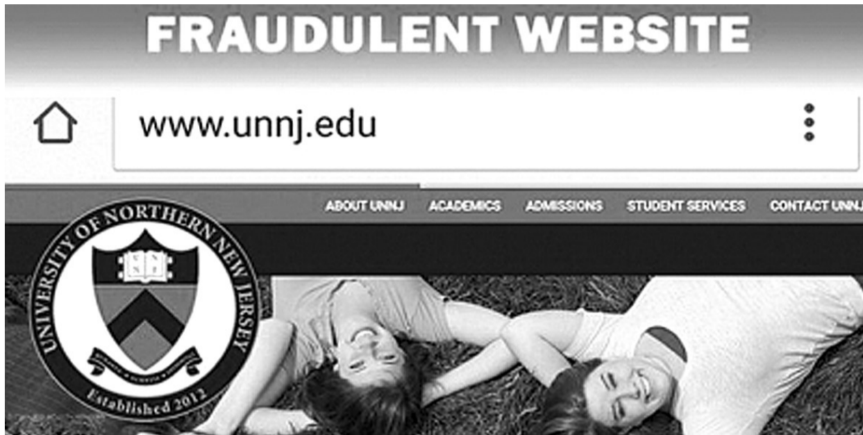
北新泽西大学的官方网站上可见其校徽。

根据美国国务院数字，2014至2015学年，就读美国高校的国际学生达到将近100万人，同比增长10%，其中近45%的生源来自中国和印度。