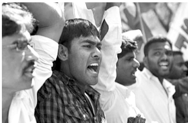
印度学生在“三谷大学”外抗议。