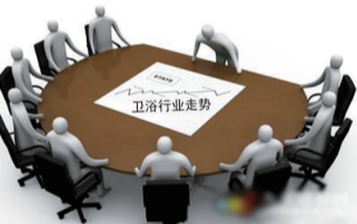
研制智能制造技术标准,包括智能制造关键技术术语和词汇表、企业

间联网和集成、智能制造装备、智能化生产线和数字化车间、智慧工厂、智能传感器、高端仪表、智能机器人、工业通信、工业物联网、工业云和大数据、工业安全、智能制造服务架构等一大批标准。在智能制造等重点领域开展综合标准化工作,重点加快制定以智能化为特征的重大成套装备、自动化生产线系统集成标准,在大飞机、发电和