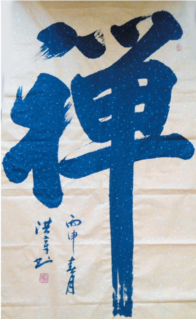
左侧两图为贾洪章书法作品