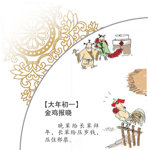
【大年初一】 金鸡报晓