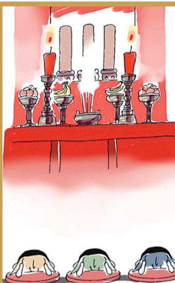
【腊月二十九】 上供请祖 对于祖先的崇拜，在我国由来已久。