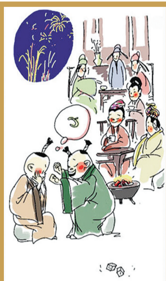
【大年三十】 除夕守岁 寒辞去冬雪，暖带入春风。