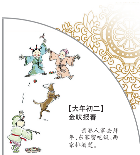
【大年初二】 金吠报春