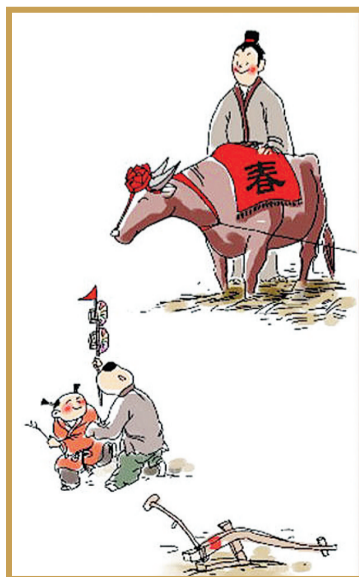
【大年初五】 艮牛耕春 五路接财神，东西南北中，财富五路通。