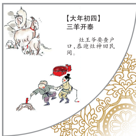
【大年初四】 三羊开泰