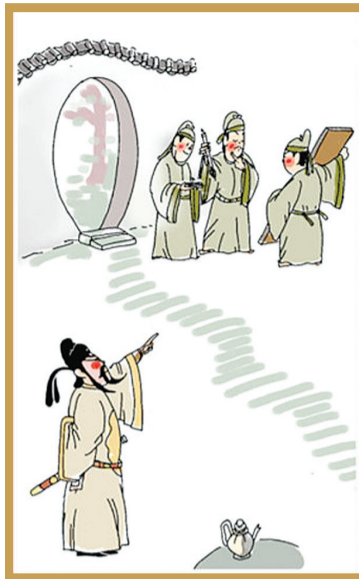
【腊月二十八】 题写桃符 古以桃木为辟邪之木，后由红纸代替。

除夕守岁是最重要的年俗活动之一，守岁之俗由来已久。最早记载见于西晋周处的《风土志》：除夕之夜，各相与赠送，称为“馈岁”；酒食相邀，称为“别岁”；长幼聚饮，祝颂完备，称为“分岁”；大家终夜不眠，以待天明，称曰“守岁”。