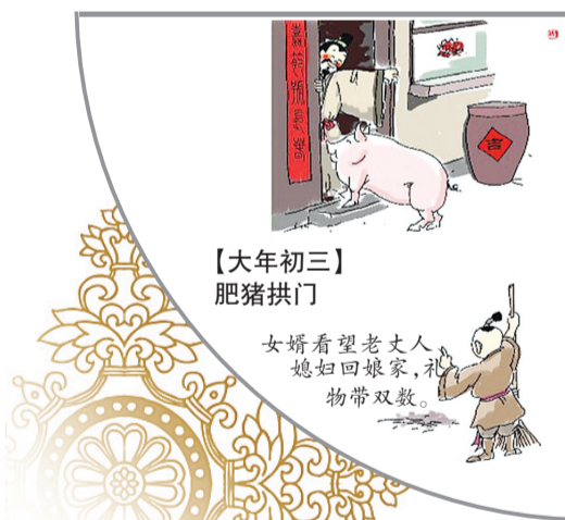
【大年初三】 肥猪拱门