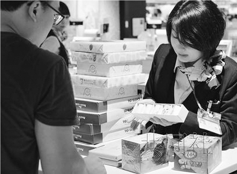
7月3日，成田机场免税店内一名店员正在应对外国游客购物。

迟，最终赶在中国游客猛增的2月春节前开业。三越伊势丹社长大西洋强调：“（机场型免税店）将激活整个银座”。免税店运营公司社长山本兵一表示：“今后将与海外300到400家旅行社合作”，计划借此提高知名度。初期单日销售额目标为3000万日元，希望尽