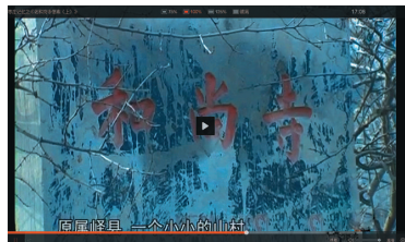
老和尚寺惨案是山东抗战时期重大惨案之一

近日,枣庄首部记录本土历史人文题材的纪录片,“记录人文记忆”的大型历史人文系列纪录片《枣庄记忆》荣获市关工委副主任、枣庄市人文自然遗产保护与开发促进会会长李华中先生题写片名。