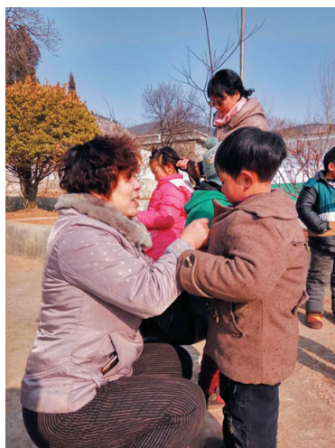
大家对孩子们关怀备至,体贴入微。