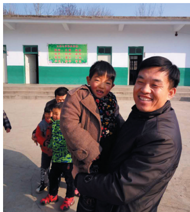
小同学露出开心的笑容。