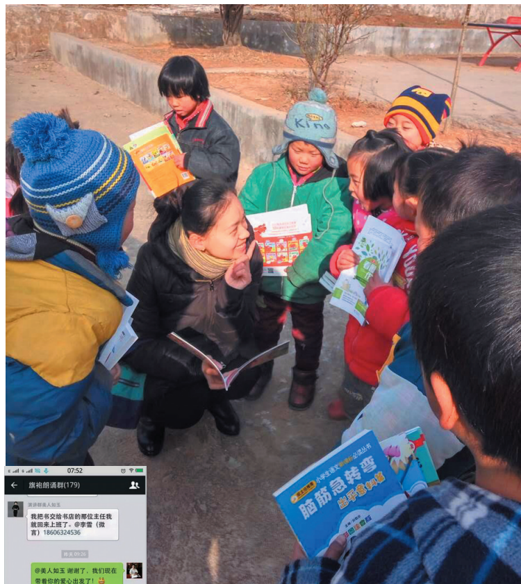
鲁南书城员工在给小同学们讲故事。