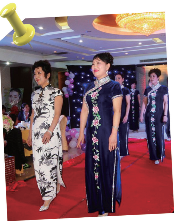
21日,在滕州市某酒店里,旗袍爱好者们组织秀旗袍表演,展示各种传统旗袍,让人大开眼界。

市立医院的王医生表示,自制的香肠中大多含有亚硝酸盐,亚硝酸盐本身不致癌,但是通过微生物的分解合成,很容易形成亚硝胺,亚硝胺则是一种致癌物。“少量食用灌肠、香肠这一类的东西是没有问题的,但是不能过量,尤其是老人和孩子应该少吃。吃完灌肠后,最好多吃水果、蔬菜,可以有效阻止亚硝胺的形成。另外灌肠要冷冻保存,不可常温保存。”王医生说。