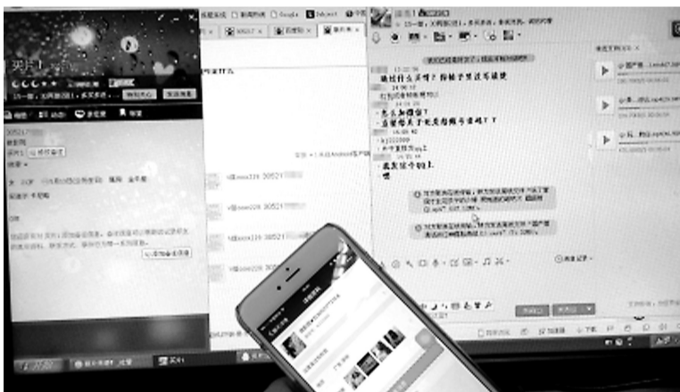
记者以买家身份,调查色情视频

发”等字样,有些则会写明“原创”。而这些原创的帖子,往往会具备较高的跟帖量,受网友的追捧几率也更高。