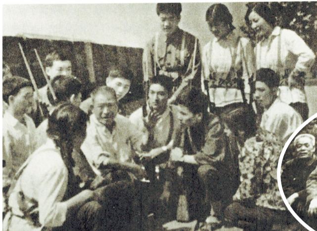
▲ 生前讲述革命故事

新年伊始,我们将剩余篇章陆续推出,以我们的文字,呈现出我们对抗战英雄的缅怀和崇敬。