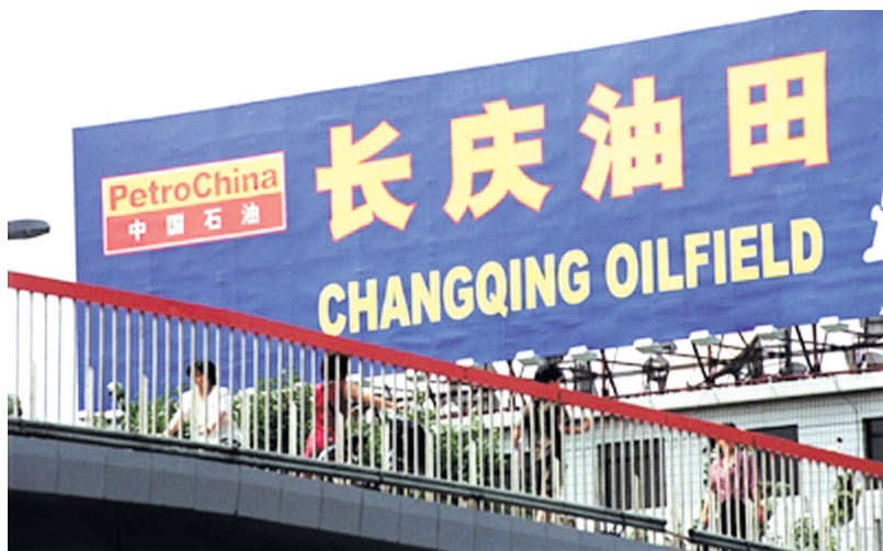
周永康之子周滨违规获得长庆油田四块油田合作及开采权，后周滨将四个油田区块转让他人，非法牟利5.4亿多元。