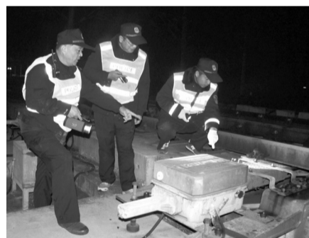
元旦期间,枣庄站派出所组织民警开展高铁线路隐患安全大排查,安装线路技防设施。对铁路防护网破损等达不到防护标准的隐患部位进行物防加固,对线路设施设备进行检查,同时对沿线群众开展爱路护路宣传。1日凌晨,所长、教导员带领民警上线安装断线报警设施,加大线路防控力度,确保节日期间铁路安全畅通。