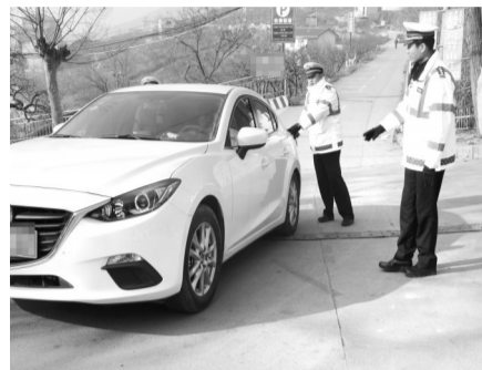
为确保元旦期间景区道路交通安全畅通,峰城公安分局交警大队组织民警提前到岗,加强交通管控,全力打造景区良好道路交通秩序。(通讯员 孙启勇 张开明 摄)