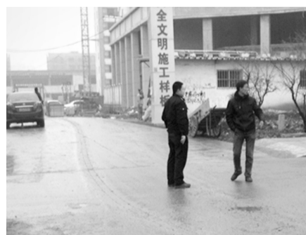
近日,薛城区城管局针对近两天下雨出现的路面泥渍,派出了执法人员专项调查、督办,对工地门口卫生维护情况、重要路段渣土运输迹象等做了细致的调查,并对门口因过往车辆进出出现轻微路面污染的工地做出警告,责令其采取补救措施,主动打扫路面,在泥渍未干的时候及时清理,并在路面湿滑的情况下注意车辆的清洁,避免带泥上路,切实维护薛城区的路面卫生。