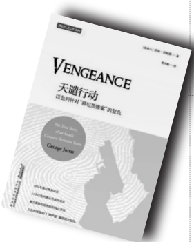
▲《天谴行动》▲ 作者:(加拿大)乔治·乔纳斯 北京时代华文书局