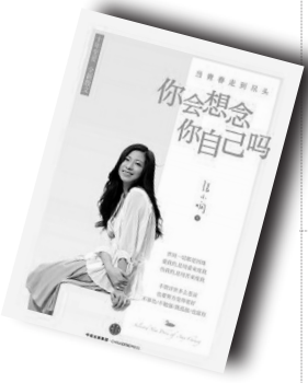
▲《你会想念你自己吗》▲ 作者:张小嫻 中信出版社