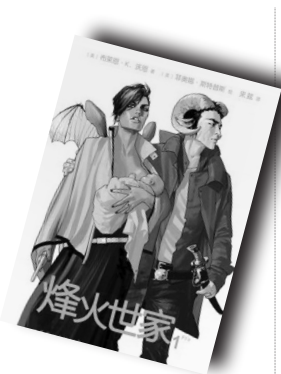
▲《烽火世家》▲ 作者:(美)布莱恩·K. 沃恩/ 菲奥娜·斯特普斯 世界图书出版公司