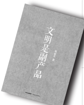
▲《文明是副产品》▲ 作者:郑也夫 中信出版社