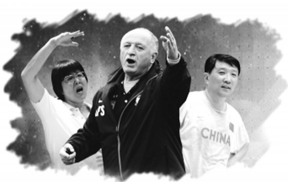
郎平(左)、▲斯科拉里、宫鲁鸣三人获最佳教练提名。

巴西名帅斯科拉里成为50个提名中唯一的外籍元素。率领恒大夺得中超、亚冠双冠,斯科拉里是中国足球在2015年最大的亮点。不过,斯科拉里的竞争对手相当强劲。宫鲁鸣率领男篮重夺亚锦赛冠军,郎平更是带着女排再次登上了世界冠军领奖台。两位个人项目教练叶瑾和袁国强,则带着弟子创造了亚洲历史:宁泽涛为亚洲第一次夺得