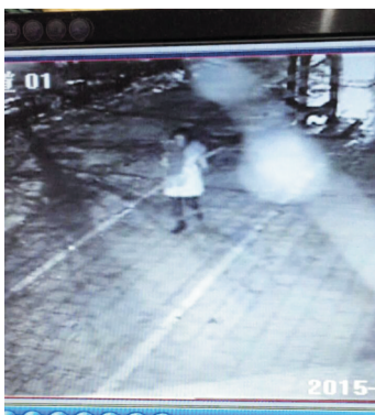
当事人提供的视频截图。