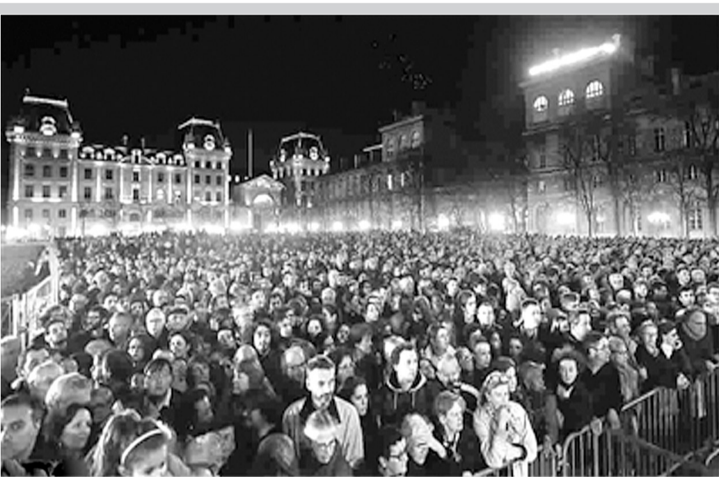
■ 15日为法国全国哀悼日首日,众多巴黎民众以及来自外省的人们来到事发餐馆、酒吧、剧院附近和共和国广场等地,献上花束,点燃蜡烛,悼念袭击中的遇难者。

法国内政部部长卡泽纳夫承认,大部分参与袭击的恐怖分子都不曾引起法国情报部门的注意。此次巴黎系列袭击是在境外策划,得到了法国境内的策应。 有报道称,恐怖分子当中有3人为亲兄弟。其中一人已在袭击中身亡,另有一人在比利时被扣留,第三人下落不明。26岁的阿卜杜勒·萨拉姆·萨拉赫据说是三兄弟之一,是出生在比利时的法国人。多名目击者看到,袭击者13日晚到巴塔克兰剧院行凶时,驾驶的是一辆比利时牌照的灰色大众轿车。而法国警方称,正是阿卜杜勒·萨拉姆租下了那辆车。目前,比利时警方已发出国际通缉令。 莫林说,警方还在另外一处遇袭地点发现一辆比利时牌照轿车,经查证,这辆车也是出租用车,租车的是一名居住在比利时的法国人。比利时警方14日逮捕了这名法国人和另外两人。这三人均不在法国情报部门的观察名单上。