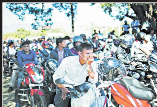
民众围聚在军方运营的加油站外等待加油。