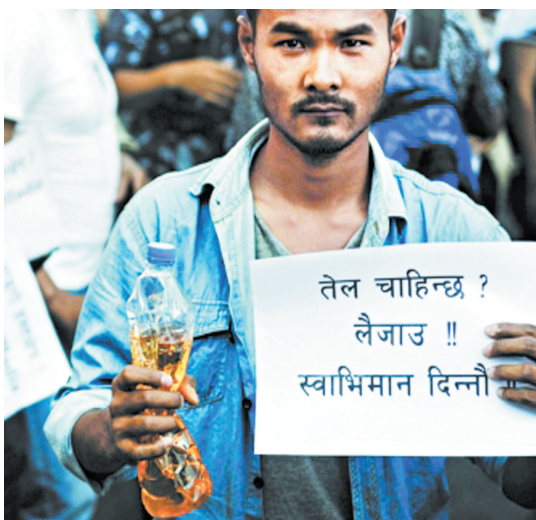
尼泊尔民众向印度使馆“捐油”以示抗议。

尼泊尔石油公司发言人提帕克26日接受新华社记者电话采访时说,本周将派出四五十辆运油车前往吉隆口岸接收来自中国的油料,但无法告知具体时间。