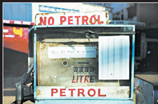
原本每升104尼泊尔卢比(约合1美元)的汽油,在黑市上要卖到300至500尼泊尔卢比。