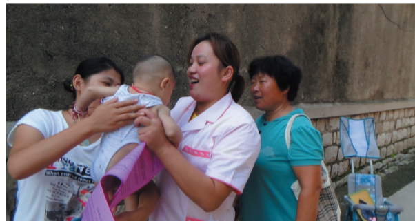
创建计生幸福家庭