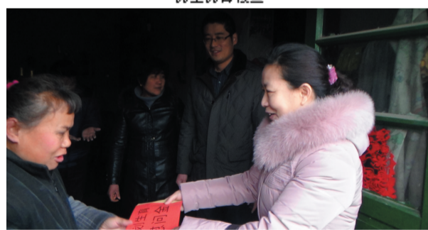
走访慰问计生困难户