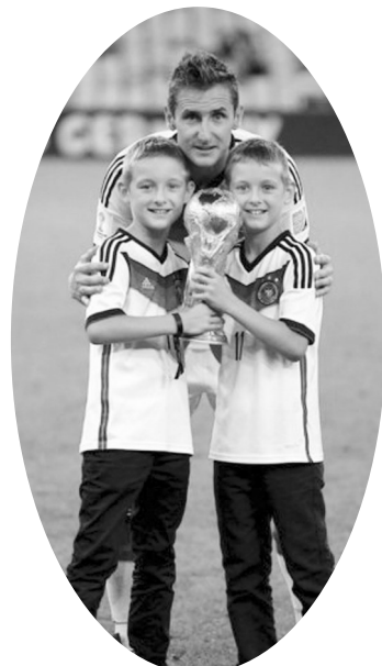
德国巨星克洛泽和他的双胞胎儿子。

儿子执意当守门员,老子却不愿意,怎么办?德国球星克洛泽有妙招:今年初,克洛泽透露,自己双胞胎儿子之一曾经当门将,有一次他和老爹夸下海口说能守住克洛泽的五脚射门,结果“克老头”第五脚射门力量太大导致儿子手部骨折,从此儿子再也不去守门了,改踢中场位置。