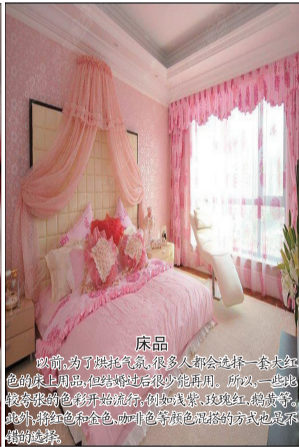
床品 以前,为了烘托气氛,很多人都会选择一套大红色的床上用品,但结婚过后很少能再用。所以,一些比较夸张的色彩开始流行,例如浅紫、玫瑰红、鹅黄等。此外,将红色和金色、咖啡色等颜色混搭的方式也是不错的选择。