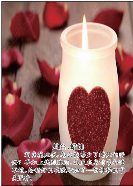
烛台、蜡烛 洞房花烛夜,怎么能够少了蜡烛的助兴?再加上热热闹闹,放置在床前最合适不过,给新婚的夜晚增加了一份神秘的唯美温情。

所谓“无房不成婚”,很多现代人结婚的前提就是要有房。那么在有了婚房之后,应该怎样布置得喜庆,让人幸福爆棚呢?在整体布置上,新婚居室要突出喜庆的气氛,那么必不可少的就要使用鲜艳的红色。红色是中国传统婚礼的主色调,能给人喜庆热闹的感觉,而除了选择红色作为婚房卧室的主色调外,还需要添置一些符合婚庆格调的装饰摆件,让整个空间变得更加浪漫多姿。今天小编就教大家几招布置婚房的诀窍,让你的新婚之夜浪漫无比。