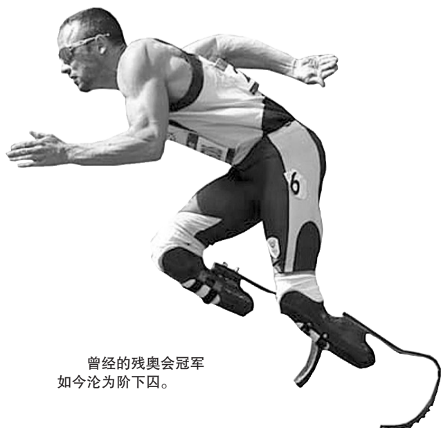
曾经的残奥会冠军 如今沦为阶下囚。

宣传海报暴露了“LD”的真正含义——一身肌肉的林丹只穿内衣,摆出了一个硬朗、性感的姿势。