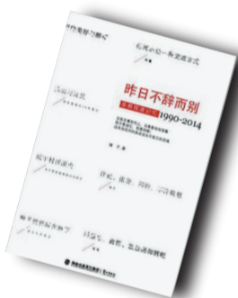
▲《昨日不辞而别》▲ 作者: 锤子 鹭江出版社

辛格,哈佛大学博士、教师,美国前国务卿,20世纪美国最著名的外交家、国际问题专家,被称为“美国政坛常青树”。1971年7月,基辛格作为尼克松总统秘密特使访华,为中美建交开启了大门,为中美关系做出了历史性贡献。他与毛泽东、周恩来、邓小平等领导人都有过深入的交往。1973年1月,基辛格在巴黎完成了结束越南战争的谈判,并因此获得诺贝尔和平奖。其主要著作有《论中国》、《大外交》、《白宫岁月》、《复兴年代》等。