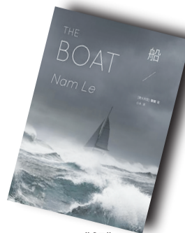
▲《船》▲ 作者: (澳) 黎南 三辉图书 / 外语教学与研究出版社

1964年生,河南南阳人,现任北京鲁迅博物馆副馆长、研究馆员,《鲁迅研究月刊》主编,中国人民大学兼职教授、博士生导师,中国鲁迅研究会秘书长。长期从事鲁迅和中国现代文学研究,编辑出版了《回望鲁迅》,《回望周作人》等史料丛书,著有《度尽劫波——周氏三兄弟》、《自然与人生的盛宴——莎士比亚戏剧》、《鲁迅与胡风》、《鲁迅图传》、《鲁迅像传》、《鲁迅:战士与文人》等。另有译作多种。