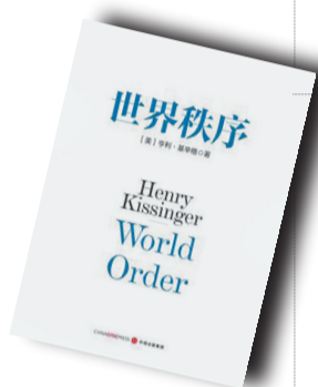
▲《世界秩序》▲ 作者: (美) 亨利·基辛格 中信出版社

内容简介: 基辛格继《论中国》后,92岁高龄的最新力作让你一本书读懂当今世界格局 21世纪国际事呈现出新的挑战。以往历史上的多数时候,世界上各个不同区域奉行着各自的秩序规则——欧洲的均势秩序观,中东的伊斯兰教观,亚洲多样化文化起源下形成的不同秩序观,以及美国“代表全人类”的世界观。在全球事务上,每个区域各行其道,结果导致了国际局势的紧张、混乱和无序。基辛格认为,地区秩序观之间的冲