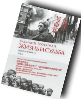
▲《生活与命运》▲ 作者: (俄罗斯) 瓦西里·格罗斯曼 广西师范大学出版社·理想国

于莫斯科大学数学物理系,当过化学工程师,1930年代投身写作行列,得到高尔基、巴别尔等文坛大家赏识,入选苏联国家作协。第二次世界大战期间作为《红星报》战地记者随军四年,大量报道莫斯科、库斯克、斯大林格勒和柏林等地前线战况,是揭露纳粹德国死亡集中营真相的第一人。战后发表小说《人民是不朽的》《为了正义的事业》等。1960年完成长篇小说《生活与命运》,手稿被苏联当局抄没并禁止出版。1964年格罗斯曼因癌症病逝。1974年,在安德烈·萨哈罗夫、弗拉基米尔·沃伊诺维奇等人帮助下,手稿被拍摄在缩微胶卷上偷运出苏联。1980年代初,《生活与命运》在欧美各国相继问世,1988年在苏联出版。