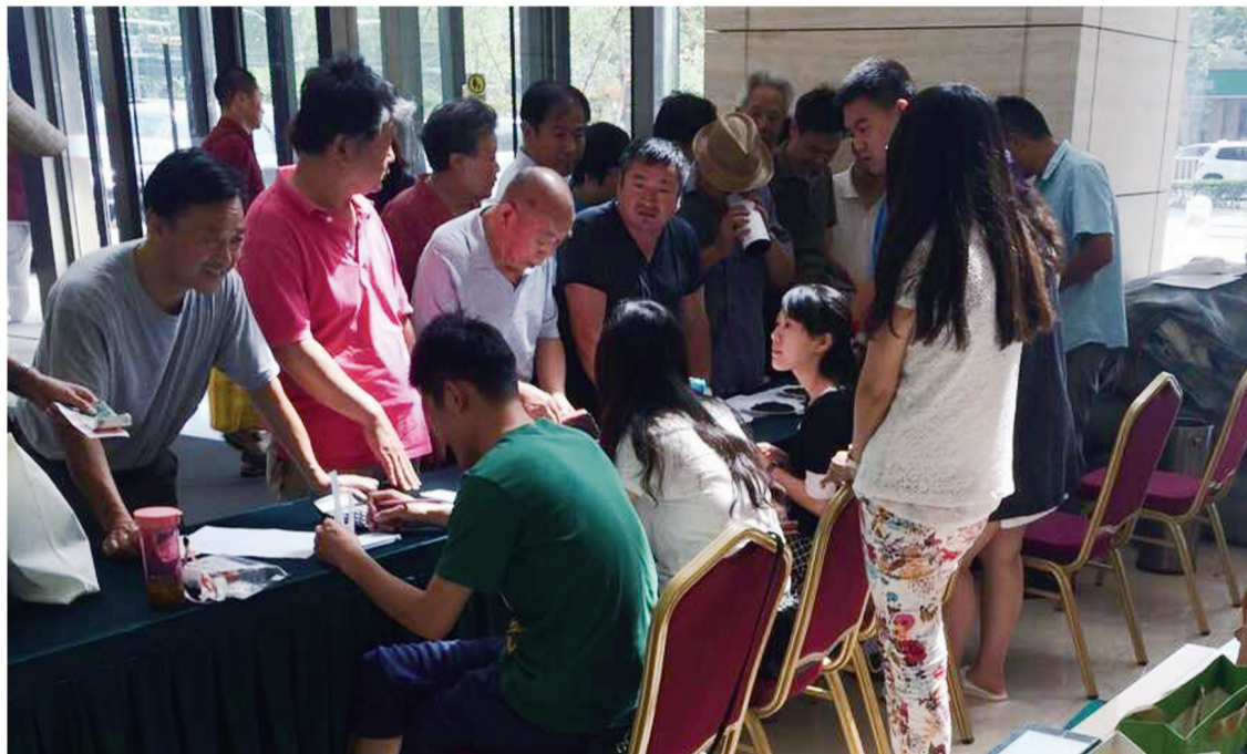
枣庄晚报读者内购会货真价实，得到读者的广泛认可。

7月31日、8月1日、2日，本报举办的读者内购会日照绿茶、红茶专场，受到市民的广泛欢迎，大家踊跃购买。