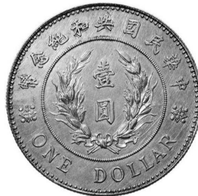
■ 中华民国共和纪念币