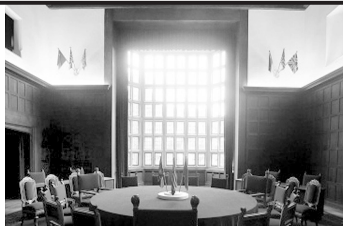
左图为记者翻拍的波茨坦会议资料照片；右图为2015年7月23日拍摄的波茨坦会议旧址一角。