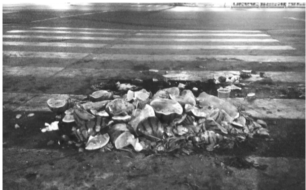
摊贩走后,西瓜留在了马路上

夏季,路边摊成了市区“亮丽”的一道风景线。路边摊的盛行,一则是因为夏季夜间出来乘凉散步的人多,二则夏季各种水果丰收,水果摊成夏季摆摊主流,但这些水果摊多是占道经营,也一时成了道路的顽疾。近日,每逢入夜,滕州主干道两侧路边摊的叫卖喇叭声便抢了汽车鸣笛声的风头,那一条条本身并不宽的马路,顿时变得拥堵。午夜时,喧嚣散尽,留在夜色中的则是一堆堆没有清理的垃圾。