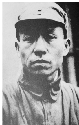
1942年过微山湖时期的刘少奇

在山东,刘少奇根据毛主席的指示,协调山东分局、八路军115师和山东纵队各主要领导人,对反“扫荡”策略和群众工作等问题产生分歧。