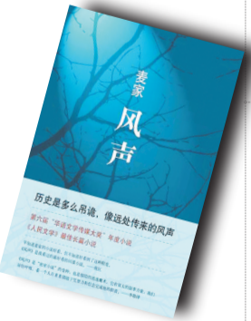
▲《风声》▲ 作者:麦家 北京十月文艺出版社

作者简介: 山姆·沃尔顿(1918—1992),沃尔玛创始人。1945年从一家“五毛店”开始进入零售业,1985年成为美国首富;2001年,他创建的沃尔玛帝国成为世界500强第一名,沃尔顿家族的5人包揽“福布斯”财富排行榜第7至第11位,成为世界上最富有的家族。山姆·沃尔顿把低价销售、疯狂促销的理念带入零售业,创立了一套严密商业哲学,改变了美国乃至全球现代零售业形态。