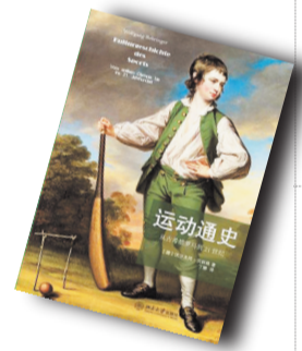
▲《运动通史》▲ 作者:沃尔夫冈·贝林格 北京大学出版社

格林的著作丰富,包括二十五部长篇小说、四部游记、六部剧作、三部自传、四部童书、数本短篇小说集,以及诗集、评论、报道等。他的多部作品被改编成电影,获奖无数,曾获诺贝尔文学奖提名高达二十一次,可惜始终未能获奖。格林曾被授予英国功绩勋章和皇家荣誉勋爵封号。