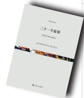
▲《二十一个故事》▲ 作者:(英)格雷厄姆·格林 上海文艺出版社

曾被评为“美国最佳医学科普记者”,三度获得“美国国家科学作者奖”。现在,他还在加利福尼亚大学伯克利分校健康管理学院工作。著有健康医学畅销书《卡路里的功与过》《节食减肥之迷思》等。