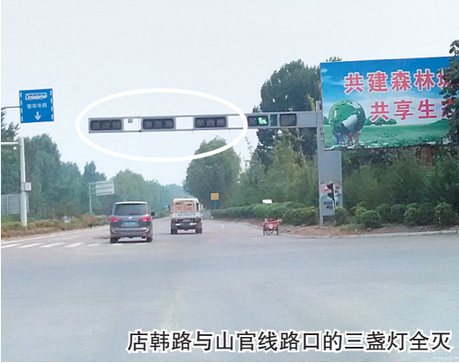
店韩路与山官线路口的三盏灯全灭