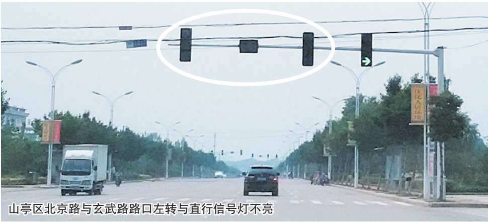
山亭区北京路与玄武路路口左转与直行信号灯不亮

路口红绿灯一半亮,另一半却不亮,如此情况你会怎么办呢？记者22日在调查中发现,我市有多处路口的红绿灯出现了这种现象。与完全损坏的红绿灯有所不同的是,“半瞎”的红绿灯存在着更大的误导性。交警部门表示,如果是因为红绿灯故障而出现的违章记录,可以酌情减轻处罚。