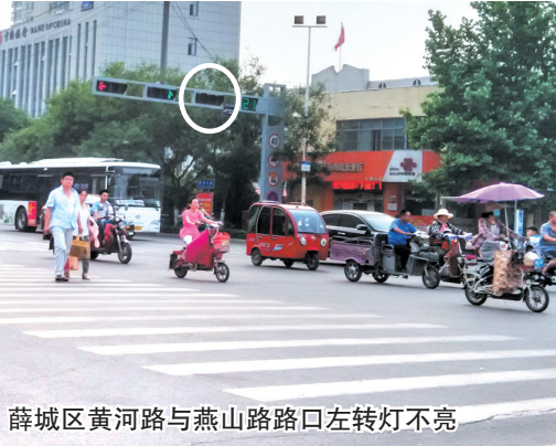
薛城区黄河路与燕山路路口左转灯不亮