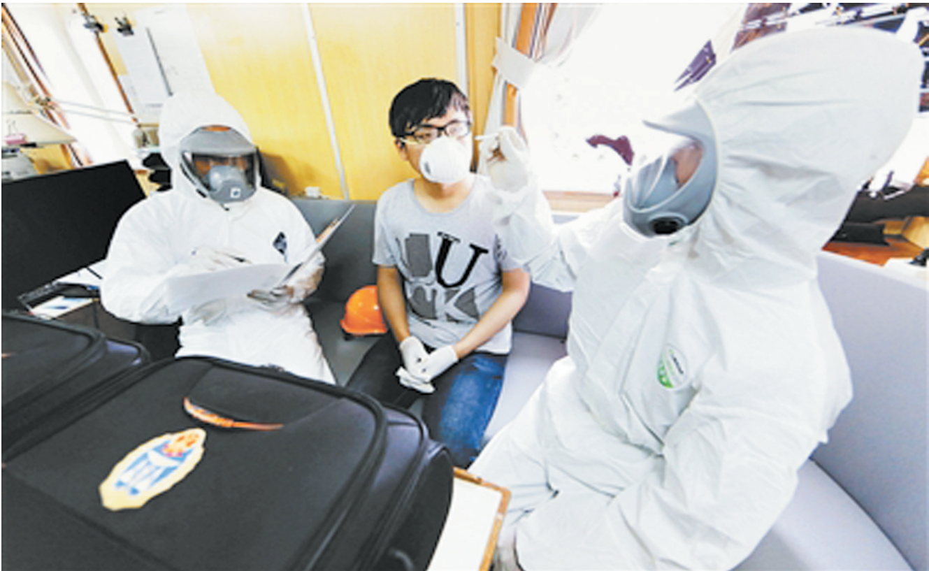
10日，江苏盐城边检和检验检疫工作人员对外籍船员进行体温检测，以防控MERS疫情入境。

这是感染中东呼吸综合征的中国女性在确诊前曾去过的位于韩国首尔华人聚居地大林洞附近的一家医院(6月10日摄)。