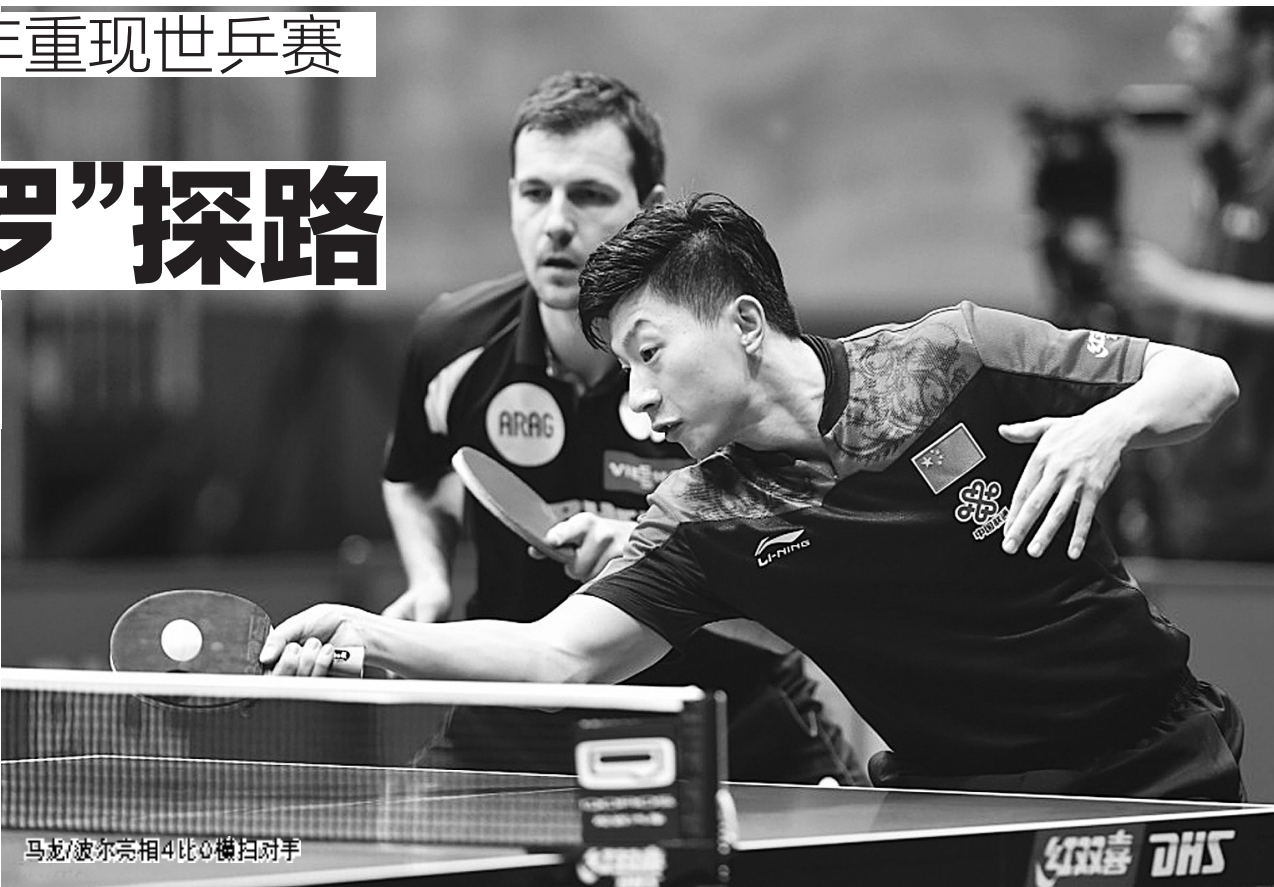
马龙/波尔亮相4比0横扫对手

27日晚,中国选手陈梦、许昕分别搭档法国选手莱贝松、韩国选手梁夏银出战苏州世乒赛混双首轮角逐——在1999年荷兰埃因霍温世乒赛白俄罗斯选手萨姆索诺夫与克罗地亚选手普里莫拉茨不敌中国队的刘国梁/孔令辉组合后16年,“跨国组合”重现世乒赛场。为力促乒乓球在国际范围内得到纵深推广,中国乒乓球队进一步出让“核心利益”,安排4名优秀选手在男双、女双、混双3个项目中组成4对跨国组合。由于中国队的优势地位岿然不动,4对跨国组合的夺冠难度不言而喻,但这种改变多少还是刺激了国外球队的竞争热情,马龙与德国队波尔组成的男双“马可波罗”即使不能问鼎,也能凭借其偶像力量聚敛较高人气,这种尝试理应得到鼓励。